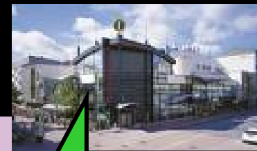
Messu- ja gaalapaikka Promenadikeskus, Yrjönkatu 17