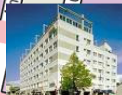
Opettajien majoitus, Scandic, Itsenäisyydenkatu 41