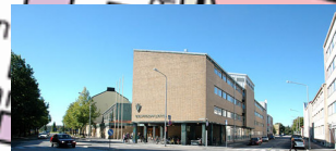
Opiskelijoiden ilmoittautuminen ja majoitus, opiskelijoiden ja opettajien ruokailut Porin ammattiopisto, Luvianpuistokatu 1